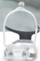
DreamWear Full Face